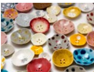
Tramai - Italy