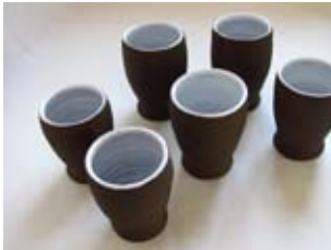
Judita Raczova - Italy