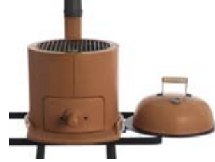
Danilo Rigon - Italy