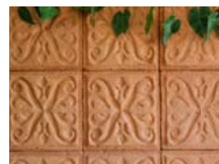
Viviane Teles - Brazil