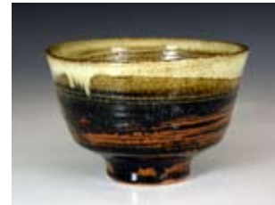
Phil Rogers - United Kingdom