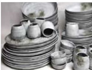
Piotr Polak - Poland