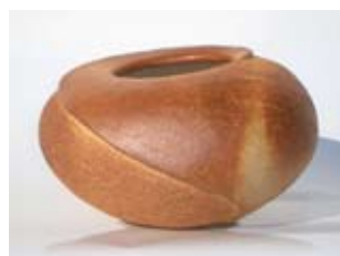
Vera Bohlen - Scotland