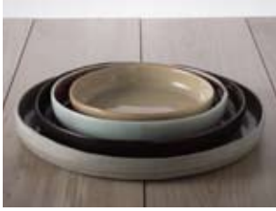
Alessio Moras - Italy