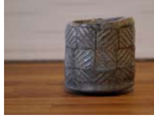
Anders Granfelt - Sweden