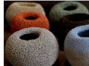
Lidia Boševski - Croatia