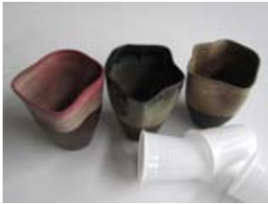
Domenico Toniolo - Italy