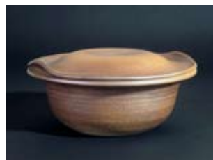
Sigrid Hovmand - Denmark